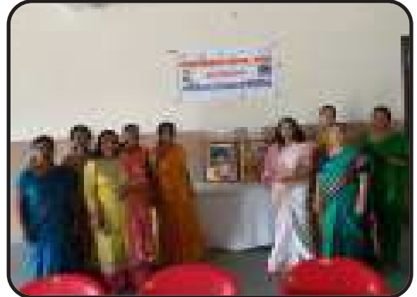
भगत सिंह कोटा, राजस्थान दक्षिण पूर्व : शाखा द्वारा महिला संस्कार शिविर का आयोजन।