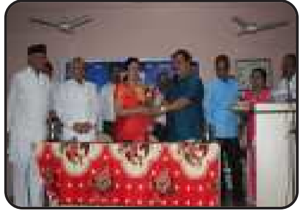
सरसबाग-पुणे, महाराष्ट्र पश्चिम : प्रान्त की नवीन शाखा का उद्घाटन।