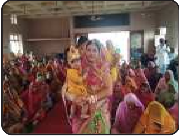
बाड़मेर, राजस्थान पश्चिम : शाखा द्वारा संगीतमय राम कथा का आयोजन।