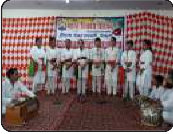
डबवाली, हरियाणा पश्चिम : शाखाद्वारा राष्ट्रीय समूहगान प्रतियोगिता का आयोजन।