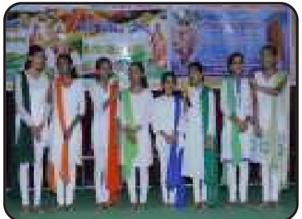
रायपुर, छत्तीसगढ़ : शाखा द्वारा राष्ट्रीय समूहगान प्रतियोगिता का आयोजन।