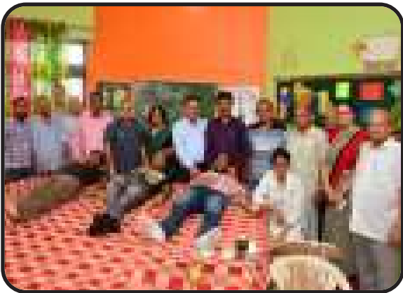
इस्माईलाबाद, हरियाणा उत्तर : शाखा द्वारा रक्तदान शिविर का आयोजन।