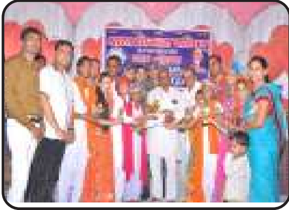
शामगढ़, मध्य भारत पश्चिम : शाखा द्वारा राष्ट्रीय समूहगान प्रतियोगिता का आयोजन।