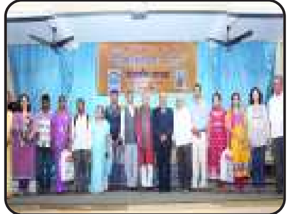
Belgaum, Karnataka North : Branch organised Pratibha Purskar programme.