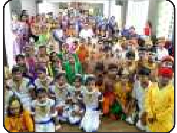
सुन्दरम अलीगढ़, ब्रज प्रदेश : शाखा द्वारा संस्कृति सप्ताह का आयोजन।