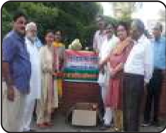
जम्मू-कश्मीर : ट्रेन सेवा बाधित होने पर परिषद् सदस्यों द्वारा रेलवे स्टेशन पर यात्रियों को अल्पाहार की व्यवस्था।