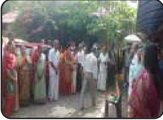
Cochin Kendra East, Kerala : Branch celebrated Independence Day.