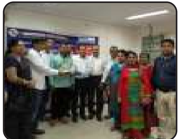
पंचदीप, दिल्ली उत्तर : शाखा द्वारा रक्तदान शिविर का आयोजन।