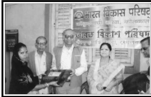
काँकड़ गादी (पश्चिम बंगाल) शाखा की ओर से कम्बल वितरण का दृश्य।