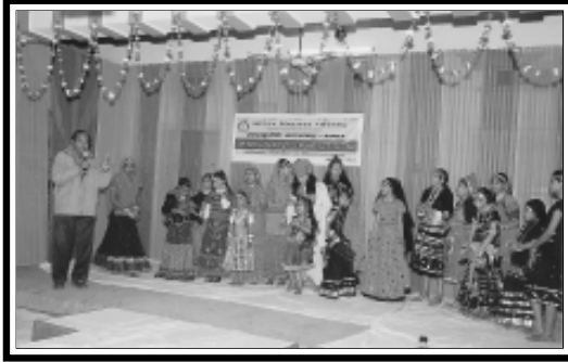
मदनगंज किशनगढ़ (राजस्थान मध्य) : प्रान्त द्वारा संस्कृति सप्ताह के अन्तर्गत राजस्थानी लोकोत्सव प्रतियोगिता का दृश्य।