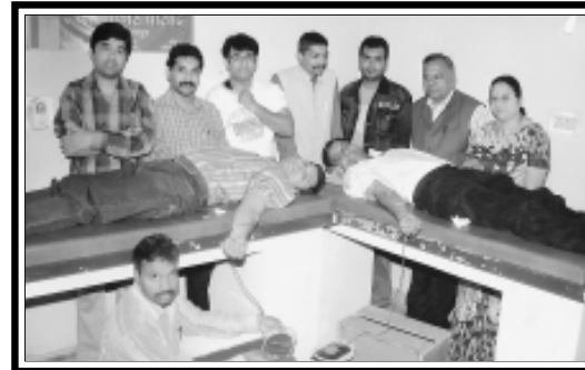
जबलपुर (महाकौशल) शाखा : रक्तदान शिविर का दृश्य।