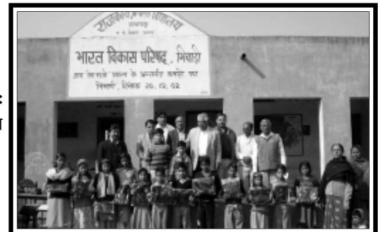
भिवाड़ी (राजस्थान पूर्व) : शाखा द्वारा कम्बल वितरण किया गया।