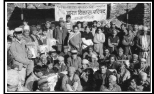
मोहणी (हिमाचल प्रदेश पश्चिम) : के अग्नि काण्ड पीड़ितों को मनाली शाखा द्वारा प्रैशर कुकर वितरण का दृश्य।