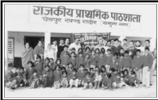
रादौर, यमुना नगर (हरियाणा उत्तर) : शाखा के सदस्यों द्वारा विद्यार्थियों को जर्सी वितरण।