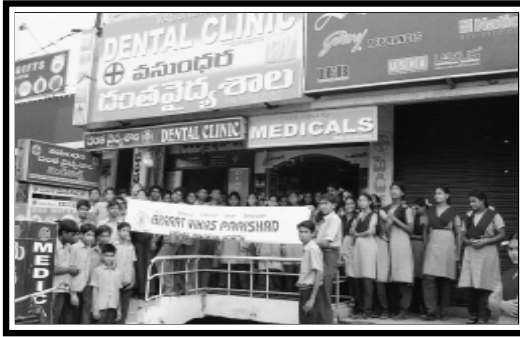
A free dental check-up camp was organised at Gajuwaka (A.P. North-East)

सुनाम (पंजाब पूर्व) : शाखा द्वारा गुरु तेग बहादुर बलिदान दिवस अत्यन्त धूम-धाम से मनाया गया।