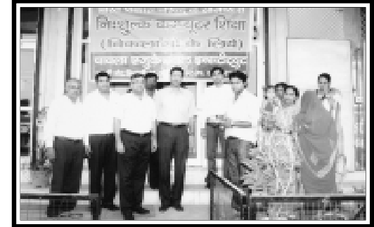
भिवानी (हरियाणा पश्चिम) विकलांगों के लिए निःशुल्क कम्प्यूटर शिक्षा का शुभारम्भ।