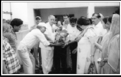
Rampur Gadwal (J&K) : Tree plantation drive on 4th Aug. 09 at the new village being developed by Jindal Trust Canada & BVP.