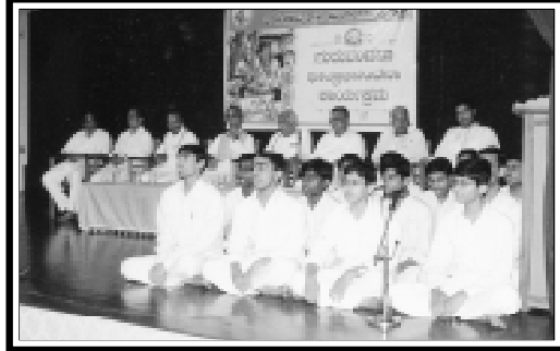
परशुराम, मंगलौर (कर्नाटक दक्षिण) : गुरु वन्दन छात्र अभिनन्दन समारोह में मंच से गीत प्रस्तुति।