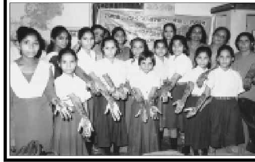
अलीगढ़ शिवम् (ब्रज प्रदेश.) में हृदी प्रतियोगिता में भाग लेती बालिकाएँ।