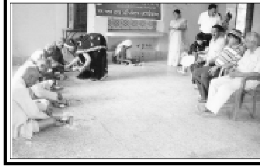
भिण्ड (मध्य भारत पूर्व) : निराश्रित भवन में भोजन परोसते भा. वि. परिषद् के कार्यकर्ता।