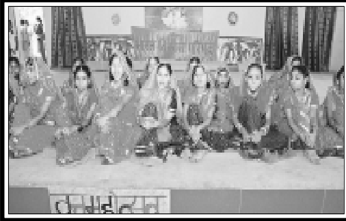
नारायण विहार (दिल्ली उत्तर) : वन महोत्सव के अवसर पर महिलाओं की प्रस्तुति।