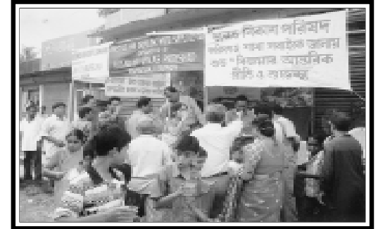
Karimganj (Assam) Provision of Drinking Water and first aid for the devotees at immersion ghat of Goddess Durga.